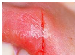
Lembi della ferita adattati con EPIGLU®, chiusi totalmente con l'adesivo