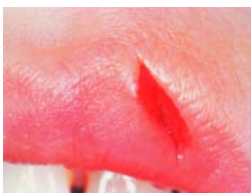
Ferita fresca, profonda