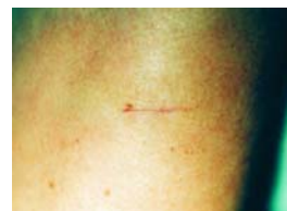
Eccellente risultato dopo 10 gg

Asportazione di nevi sull'avanbraccio sinistro, sutura intracutanea. Trattamento con EPIGLU®