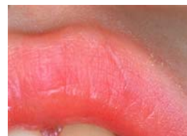
Guarigione della ferita dopo 11 gg