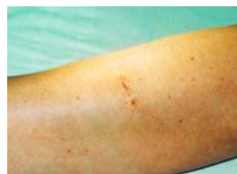
Stato 5 giorni dopo l'intervento